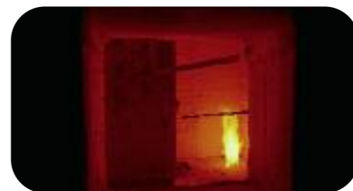
Tests effectués en situation réelle.