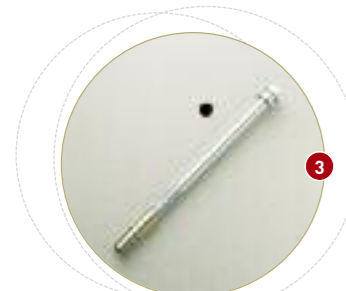
Trou de scellement à la base ø 14 mm.