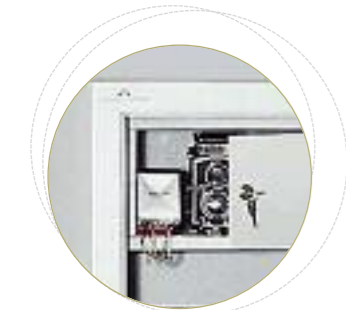
Option : Coffre intérieur fermant à clés (2 clés fournies).