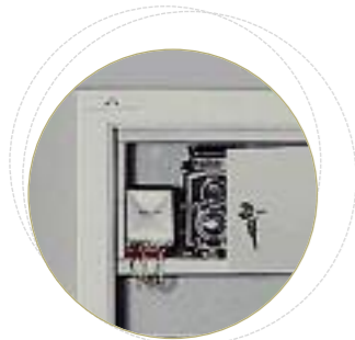
Option : Coffre intérieur fermant à clés (2 clés fournies).

Classe 1 • Norme Européenne EN 1143-1 • Valeur assurable : 25 000 € Homologation Ignifuge 1 heure papier • Norme Européenne EN 1047-1/S60P