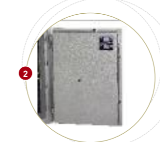
Verrouillage de la porte sur les 4 côtés par pènes actifs/passifs, anti sciage ø 20 mm.