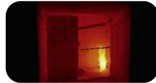
Tests effectués en situation réelle.