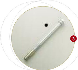
Trou de scellement à la base ø 14 mm.