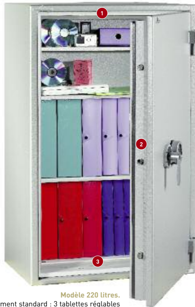
Modèle 220 litres.

Équipement standard : 3 tablettes réglables sur crémaillères au pas 40 mm.