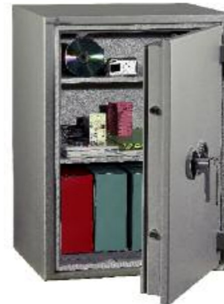
Modèle 123 litres.

Serrure à clé WITTKOPP(réf. 2618) testée A2P niveau A. 2 clés fournies + serrure électronique classe 2 VDS.