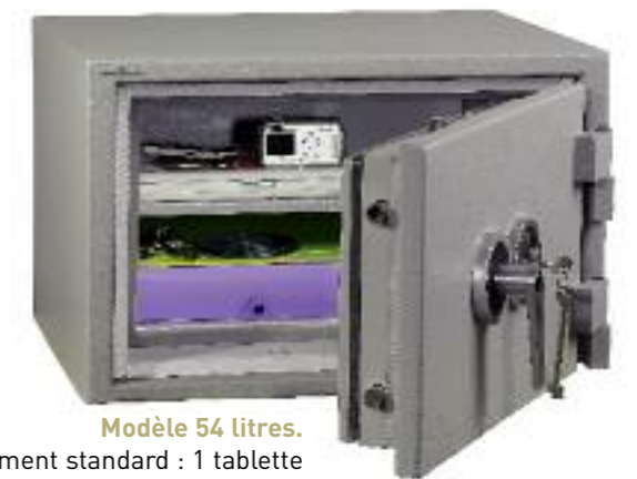
Modèle 54 litres.

Équipement standard : 2 tablettes réglables sur crémaillères au pas 40 mm.